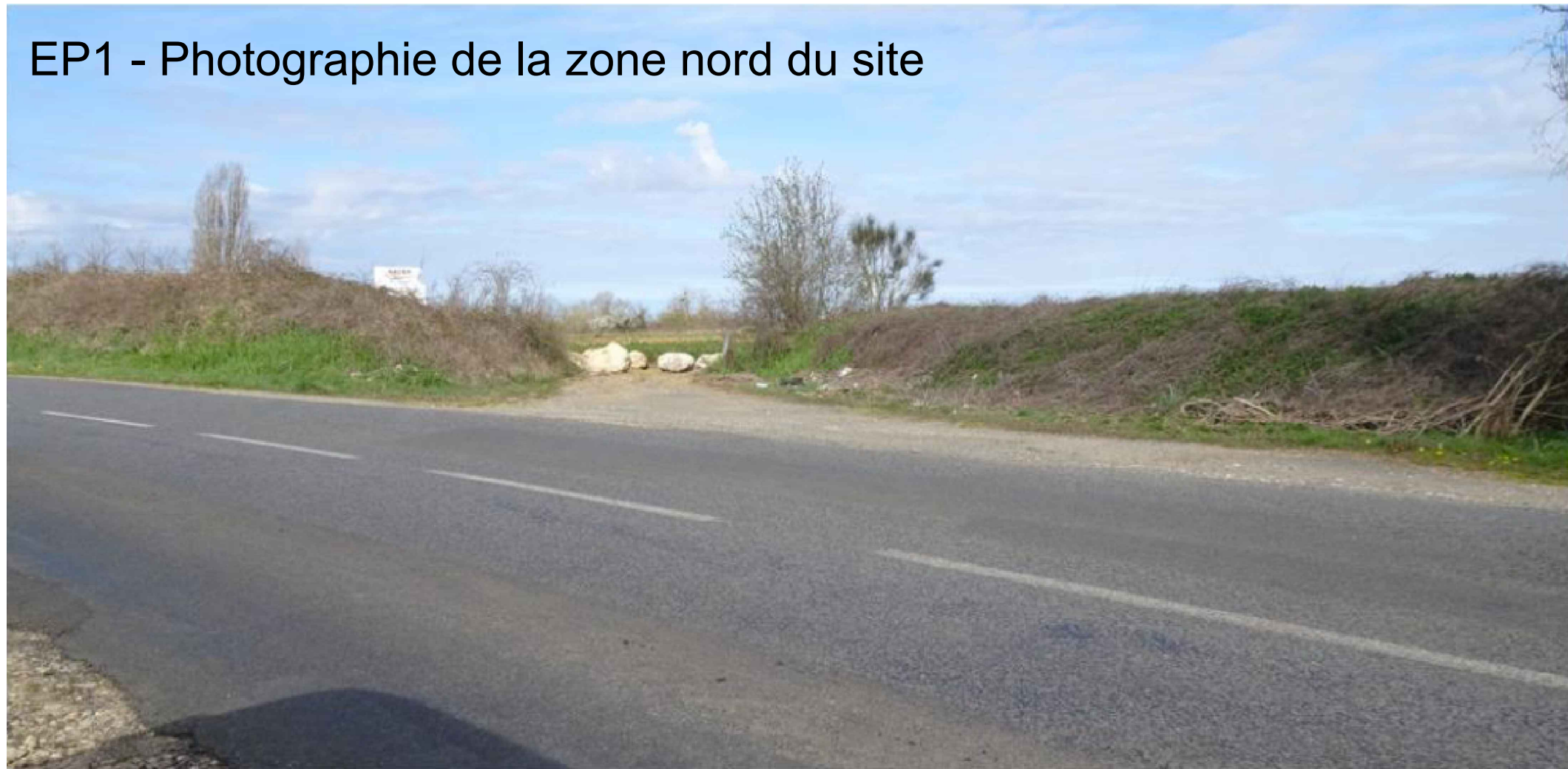
EP1 - Photographie de la zone nord du site

Parc photovoltaïque de Vouneuil-sous-Biard